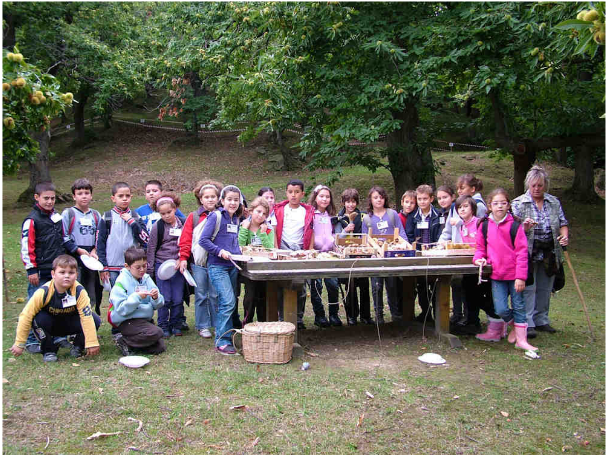
LA 4 A ELEMENTARE A LEZIONE NEL BOSCO DELLE "SELVE"