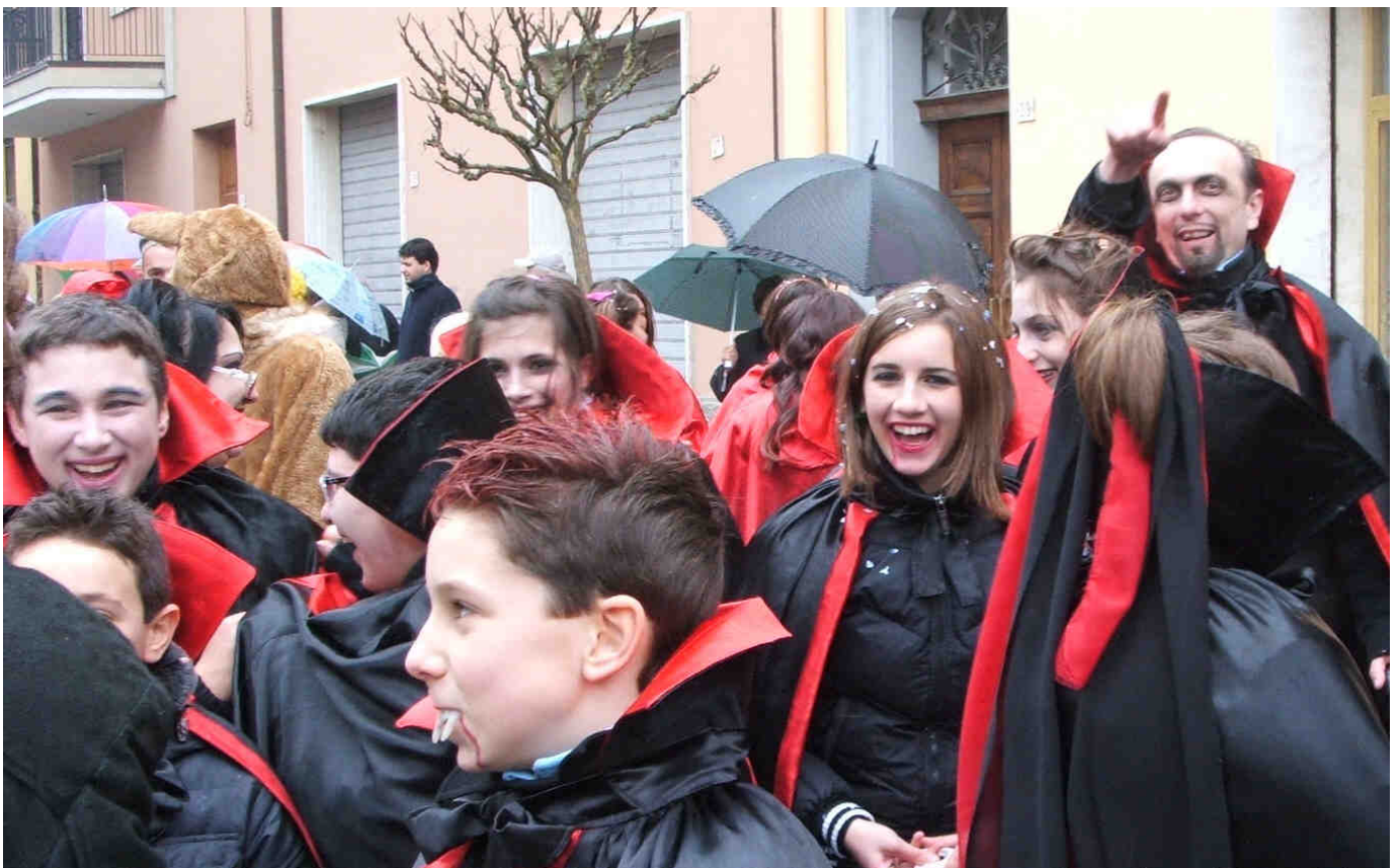
I VAMPIRI DELL'AVIS AL CARNEVALE 2010