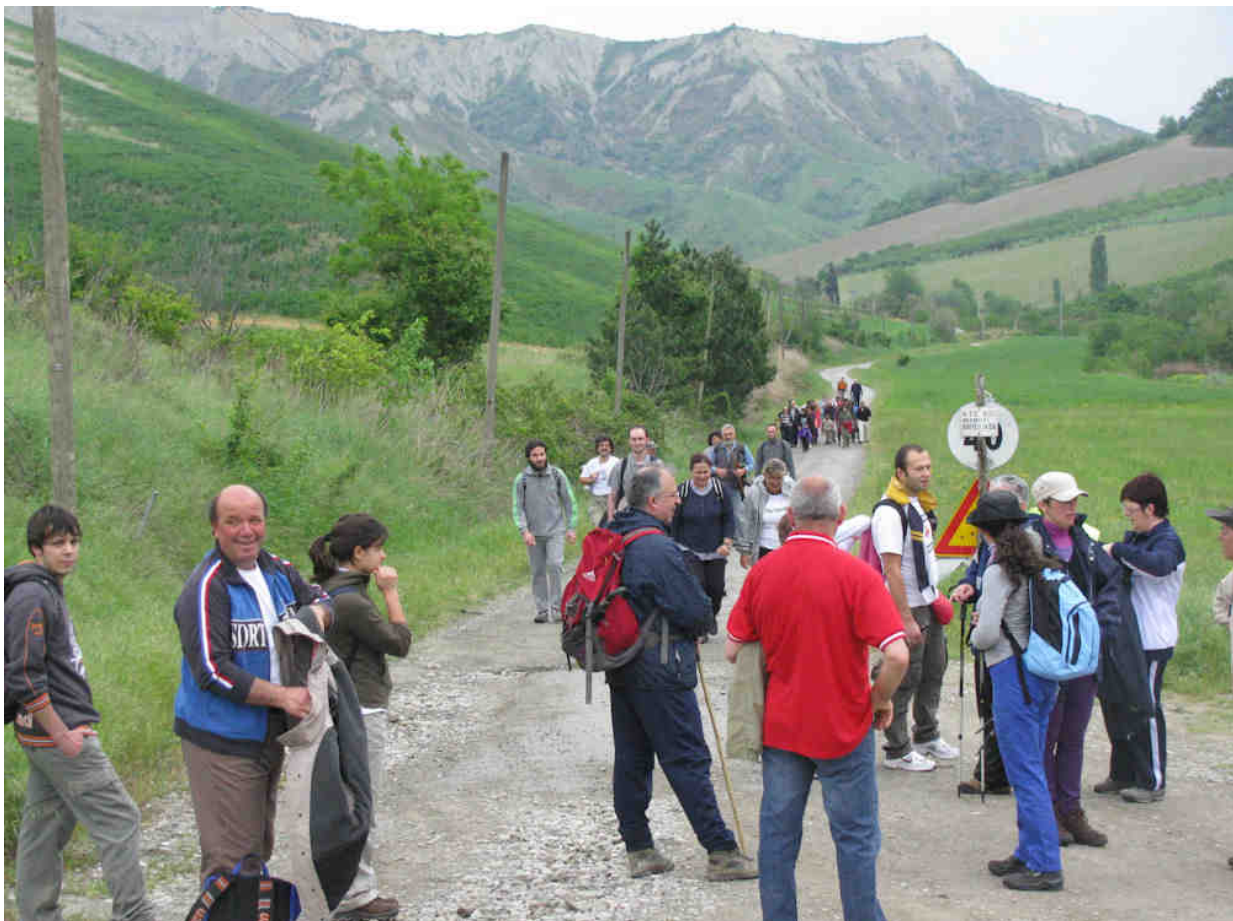
L'ESCURSIONE NELL'ANELLO DEL RIO MESCOLO IL 16 MAGGIO