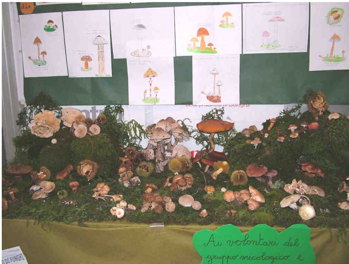
MOSTRA DEL FUNGO: LA SEZIONE ALLESTITA DALLA 4 a ELEMENTARE