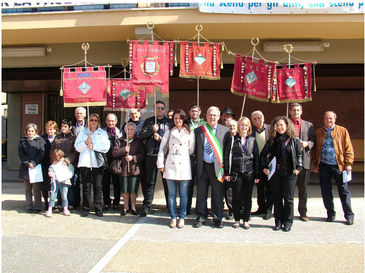
FESTA SOCIALE- 18 APRILE