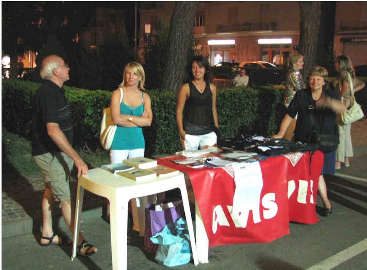
BANCHETTO ALLA SAGRA DI SAN BARTOLOMEO