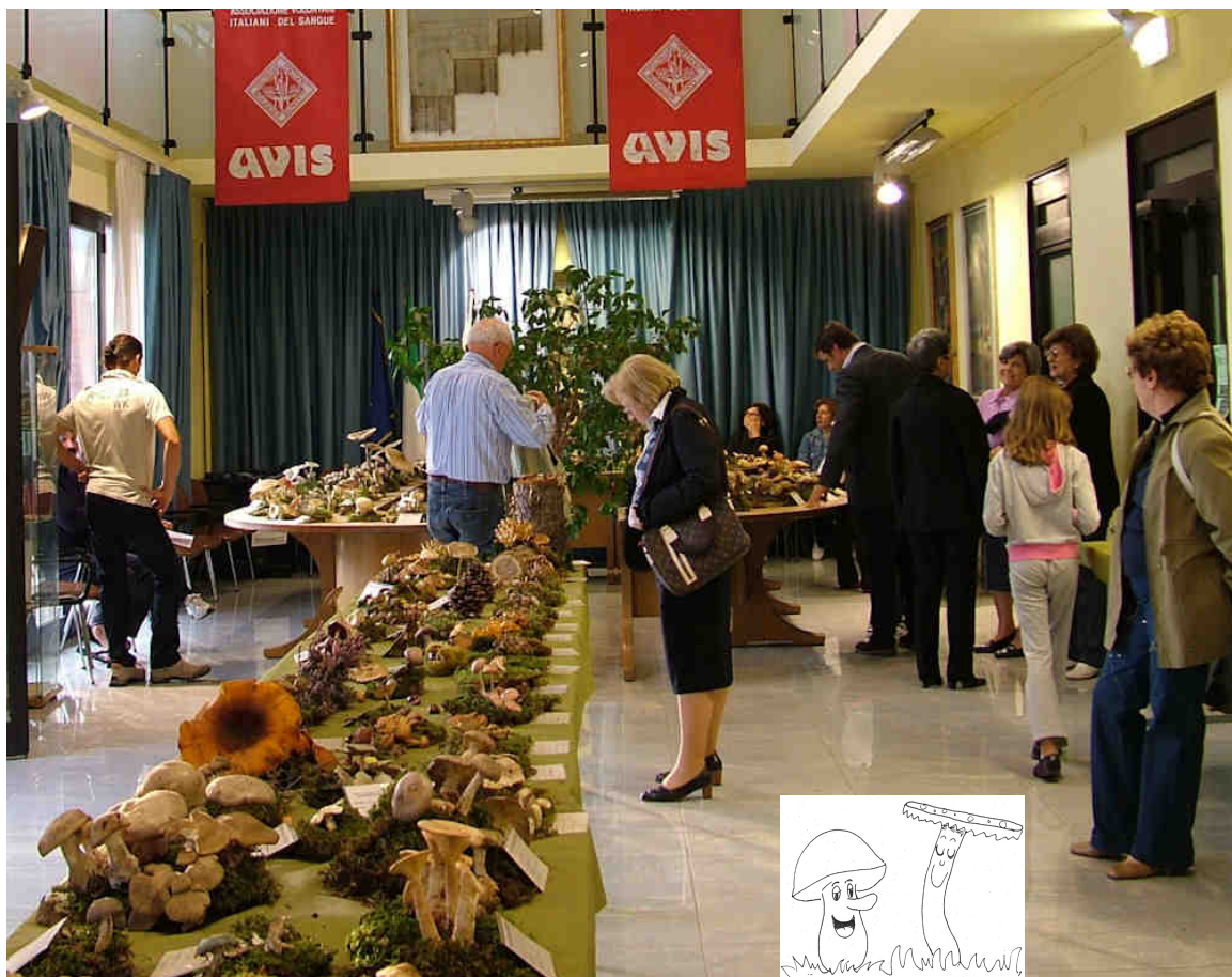
LA MOSTRA ALLESTITA DAL GRUPPO MICOLOGICO IMOLESE NELLA SALA CONSILIARE