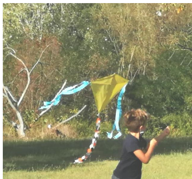
Aquiloni in volo