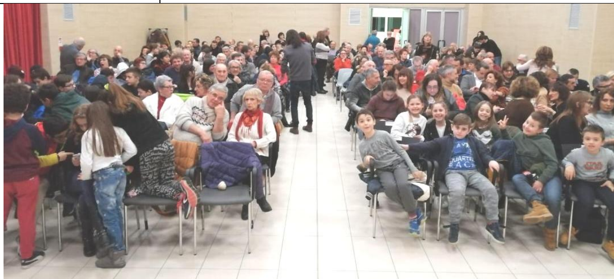
Proiezione de "la regina di Casetta" in sala polivalente