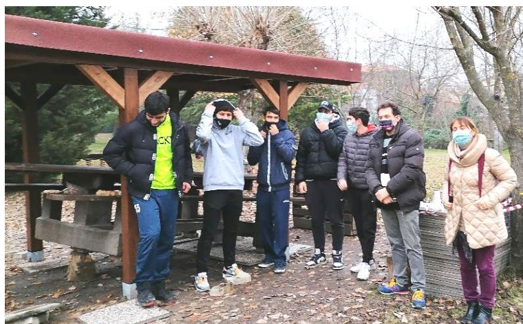
I nuovi gazebo nel Parco del Donatore