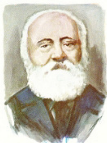
Antonio Meucci (1808 - 1889)